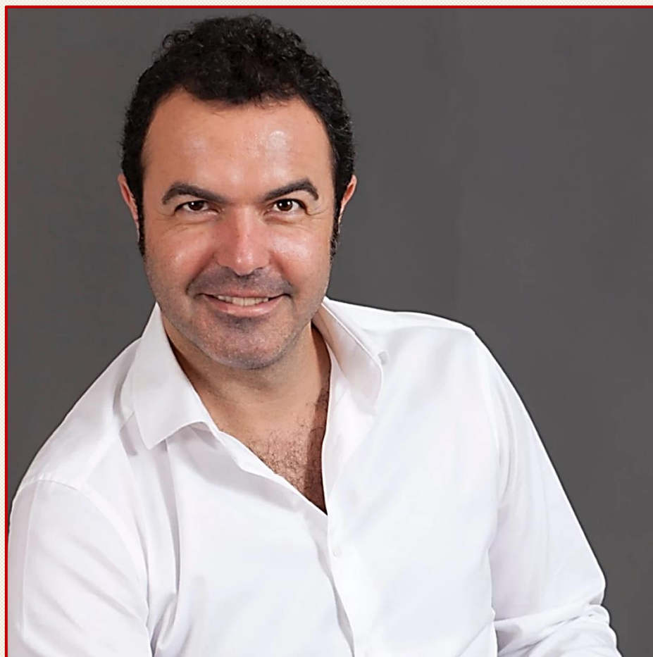
SIMÓN ORFILA, UN BAJO-BARÍTONO EXCEPCIONAL