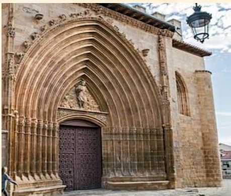
San Juan Bautista

La Iglesia de San Juan Bautista, junto a los ríos Duero y Bañuelos, alberga en su interior el Museo de Arte Sacro. Posee una torre-campanario del s. XII de la antigua edificación, momento en que se considera el origen de la Villa de Aranda. La iglesia actual se erigió entre los siglos XIV y XV. La fachada sur, con nueve arquivoltas, es de estilo gótico burgalés. En el s. XVI se colocó una imagen barroca de San Juan Bautista. En 1473 se celebró en este lugar el Concilio de Aranda.