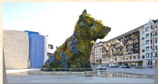
Jeff Koons, Puppy , 1992