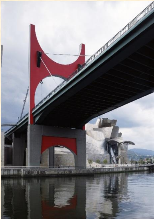
Daniel Buren, Arcos Rojos, 2007