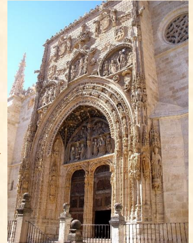
Santa María La Real

La Iglesia de Santa María La Real, levantada entre los siglos XV y XVI, es el símbolo de la villa con su bellísima portada-retablo dedicado a la Virgen María. En el Parteluz hay una imagen de la Virgen amamantando al niño. En el tímpano, se encuentra la Anunciación. La fachada, de estilo gótico tardío se atribuye a Simón de Colonia. Hay una cierta semejanza con la fachada de San Pablo y el Colegio de San Gregorio, ambos en Valladolid. La torre románica es de la anterior edificación.