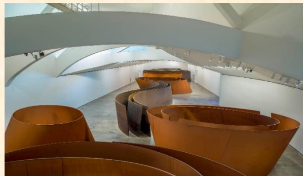
Richard Serra, The matter of time , 1994-2005