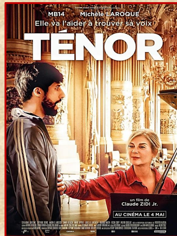
Dirigida por Claude Zidi Jr. 2022